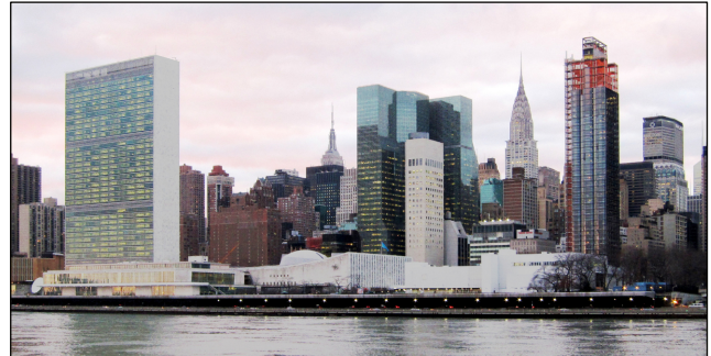
Vue depuis Roosevelt Island sur le siège principal des Nations Unies à New York.

illégale et non provoquée des Etats-Unis et d'Israël contre l'Iran. Le comportement de ces pays est honteux et il a complètement inversé la réalité.