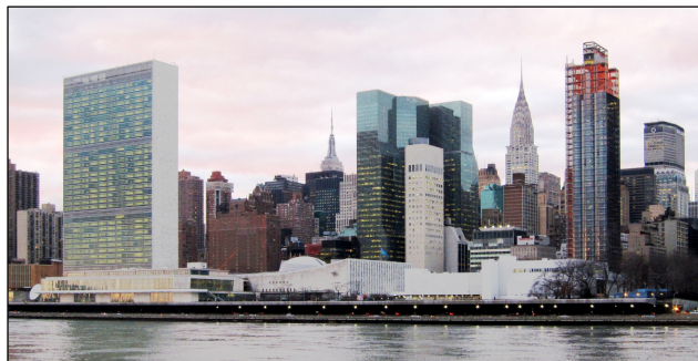
Blick von Roosevelt-Insel auf das UN-Hauptquartier in New York.

Auf der Sitzung des Sicherheitsrats 1 am 28. Februar 2026 richteten die USA und ihre Verbündeten ihre Verurteilung nicht gegen die amerikanische und israelische Aggression, sondern gegen den Iran. Ein US-Verbündeter nach dem anderen verurteilte den Iran für seine Vergeltungsschläge,