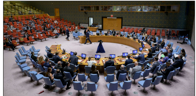
Nur die Sanktionen des UN-Sicherheitsrats können universelle Geltung und Zustimmung beanspruchen.

Freilich verhängt nicht nur die UNO Wirtschaftssanktionen. Auch einzelne Staaten oder die EU