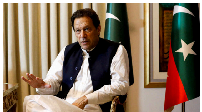
Imran Khan

« Imran Khan est un homme extrêmement fin et un excellent homme d'Etat pakistanais, et les Etats-Unis ont contribué à le priver de ses pouvoirs. C'est une histoire très désagréable que « The Intercept » a mise en lumière. Quand Imran Khan ne s'est pas immédiatement rangé du côté des Etats-Unis en ce qui concerne les relations avec la Russie et la Chine, l'Etat américain de la sécurité fonctionnait selon le modèle suivant: