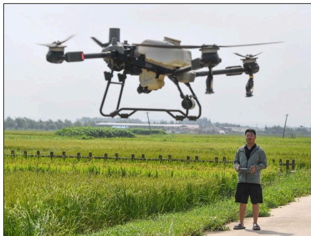
Innovations dans le domaine de l'agriculture.

La Chine et la Suisse disposent de fortes complémentarités économiques et d'un large espace de coopération, avec un énorme potentiel pour les secteurs tant traditionnels qu'émergents, tels que l'économie verte, l'économie numérique, les sciences de la vie et d'autres domaines. La