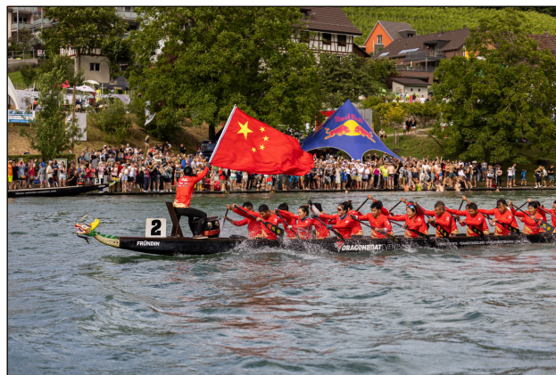
Equipe chinoise lors de la course de bateaux-dragons à Eglisau en juin 2024.

C'est un grand honneur pour moi de travailler et de vivre dans cette magnifique ville de Zurich. J'y ai beaucoup gagné: que ce soit dans une ville pleine d'histoire et de diversité comme Zurich ou dans une région rurale calme et accueillante, la