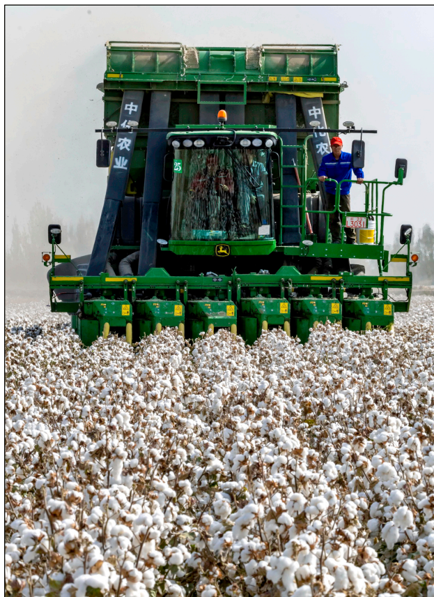
Récolteuse de coton moderne en action.

En juillet dernier, le Parti communiste chinois a tenu la troisième session plénière de son vingtième Comité central, au cours de laquelle il a été décidé de s'engager systématiquement dans l'approfondissement global des réformes et la promotion de la modernisation, avec pour objectif global de perfectionner et de développer